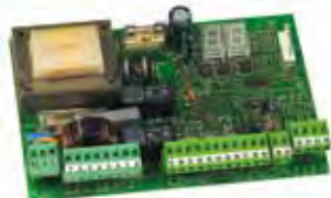
Motorsturing 455 D Technische spec. zie Pag. 187