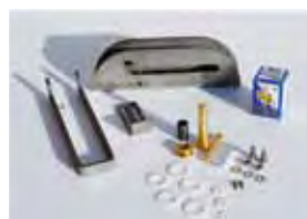
SDE 390, extern ontkoppelingssysteem zonder kabel, voor ontgrendeling van de hekvleugel