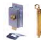
Diverse toebehoren Pagina 179