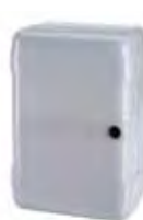
Huizing mod. LM voor motorsturing (afm. h 353 x b 246 x d 141)