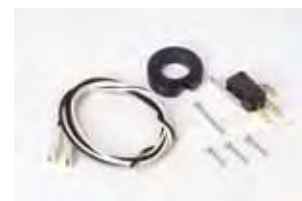
Kit eindeloop (open en dicht)*