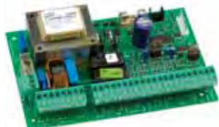
Motorsturing 462 DF Technische spec. zie Pag. 188