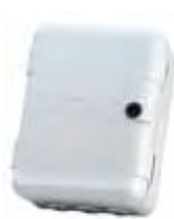
Huizing mod. L voor motorsturing (afm. h 265 x b 210 x d 115)