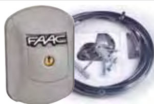
Ontgrendelingsmechanisme inclusief kabel en cylinderslot XK21L 24V